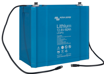
12,8 V 60 Ah LiFePO 4 Batterie