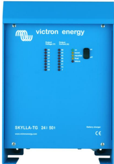
Skylla TG 24 50