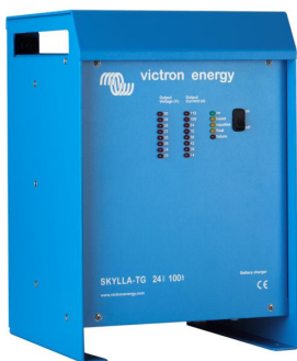
Skylla TG 24 100