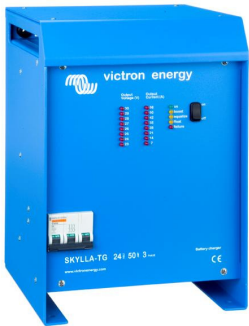
Skylla TG 24 50 3 phase

In unsere Broschüre „Immer Strom“ erfahren Sie mehr über Batterien und ihre Ladung. Sie erhalten die Broschüre kostenlos bei Victron Energy oder unter www.victronenergy.com im Internet.